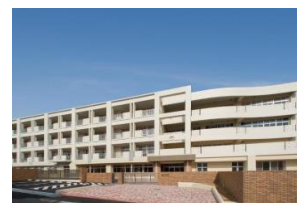
永犬丸西小学校 徒歩6分(約480m)