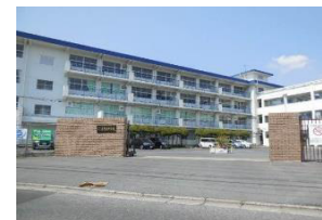
永犬丸中学校 徒歩9分(約715m)