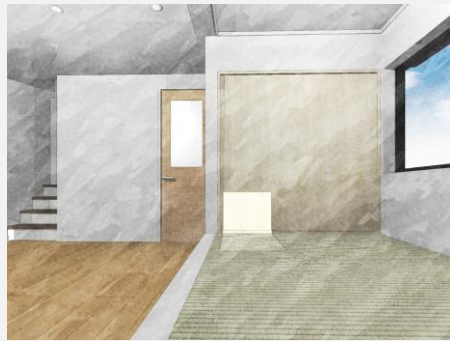
小上がりのタタミコーナー