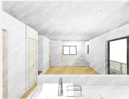
キッチンに立つとLDK全体が見わたせます。