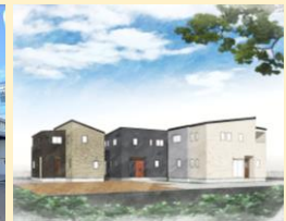
全5区画の閑静な住宅街