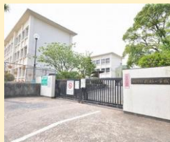
則松小学校 徒歩9分(約660m)