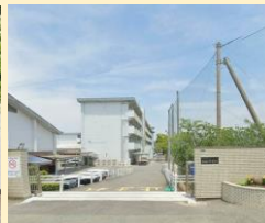
則松中学校 徒歩14分(約1070m)